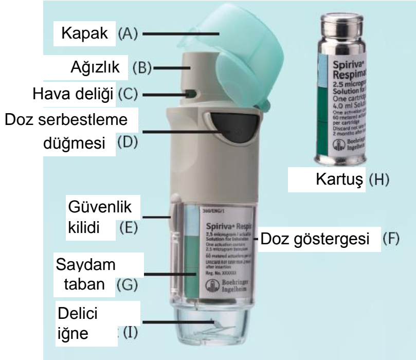
SPIRIVA RESPIMAT inhale ve SPIRIVA RESPIMAT kartuş

Kartuşun yerleştirilmesi ve kullanıma hazırlama