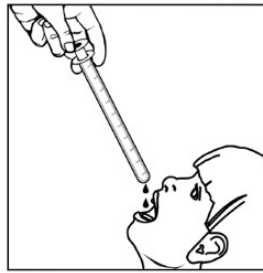
3. Ölçülen dozu, bir kaşık ya da bardak yardımı ile veya doğrudan çocuğun ağızına uygulayınız. Dozun tam olarak verildiğinden emin olunuz.