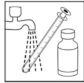
4. Her kullanımdan sonra, şişeyi kapatınız ve şırıngayı dikkatli bir şekilde su ile yıkayınız. Şırıngayı şişe ile birlikte ambalajı içinde saklayınız.