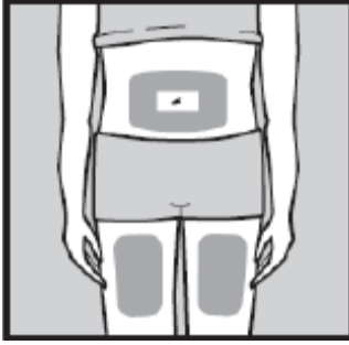
Şekil No: 2